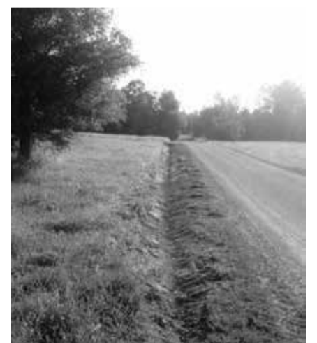
Kullametsa kaare teeäärse uus kraav

Teeäärte niitmine toimub nagu igal aastal- algab augusti teisel nädalal ja lõpeb hiljemalt tarkusepäevaks esime- seks septembriks. Teede hõõveldami- ne on plaanitud september-oktoober. Kruusa pealevedu- aukude paranda- mist, -tasandamist koos truupide re- mondi ja vahetamisega plaanime au- gustist oktoobrini.