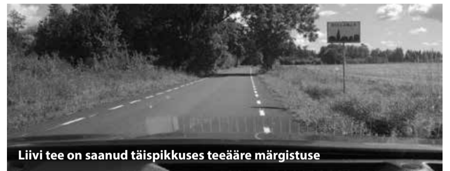
Liivi tee on saanud täispikkuses teeäärse märgistuse