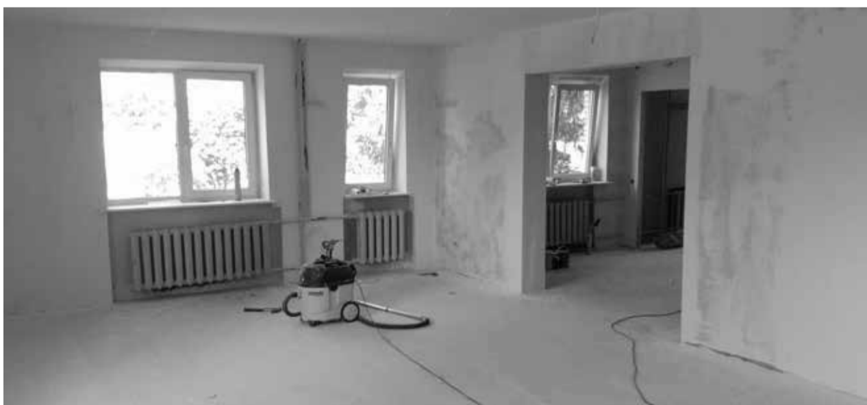
Remondi käigus lammutati endise ühiselamu vaheseinad.