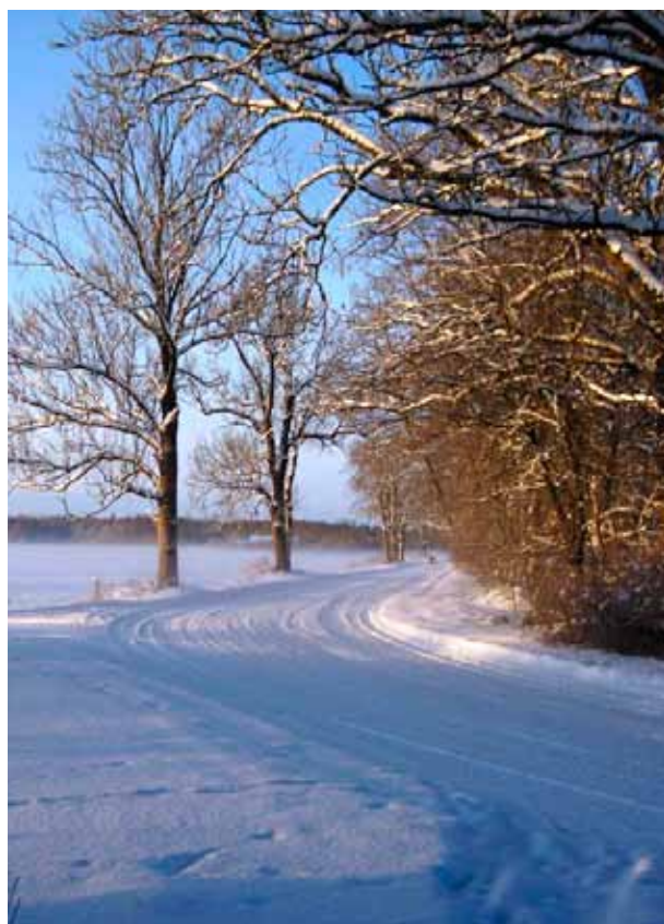
Lumine vaade Liivi teele Kullamaal.

Tulemas on: sõbrapäeval, kus valitakse kooli sõbralikumad tüdrukud, poisid, õpetaja ja koolitöötaja; tordioksjon, mille tulu läheb Haapsalu kasside ja koerte varjupaigale; teadusbussi külaskäik; külastatakse Kadrioru muuseumi, kus eksponeeritakse Leonardo da Vinci kuulsat portreemaali; meile tuleb külla Eesti Kontsert muusikaseminariga „Muusika loomise moodused läbi aegade”; 23. veebruaril on koolis EV aastapäeva aktus; tulemas on 6. klasside olümpiaad ja veerandi viimasel päeval toimub koolikonverents.