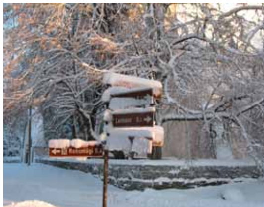
Lumine Kullamaa keskus.

Sellest hoolimata soovime Teile kaunid talverõõme ja sooja tuba!