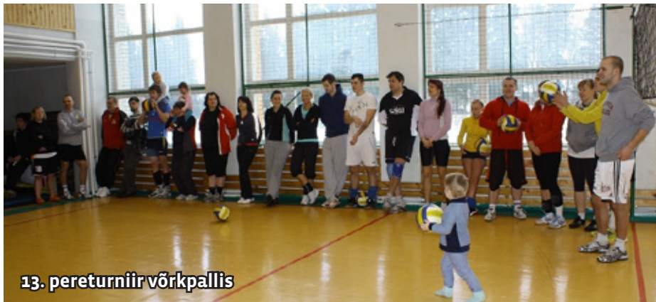
13. pereturniir võrkpallis

Päeva lõpetuseks vastlakuklid, seajalad, hernesupp ja tee. Osalejad kiitsid kokkasid!