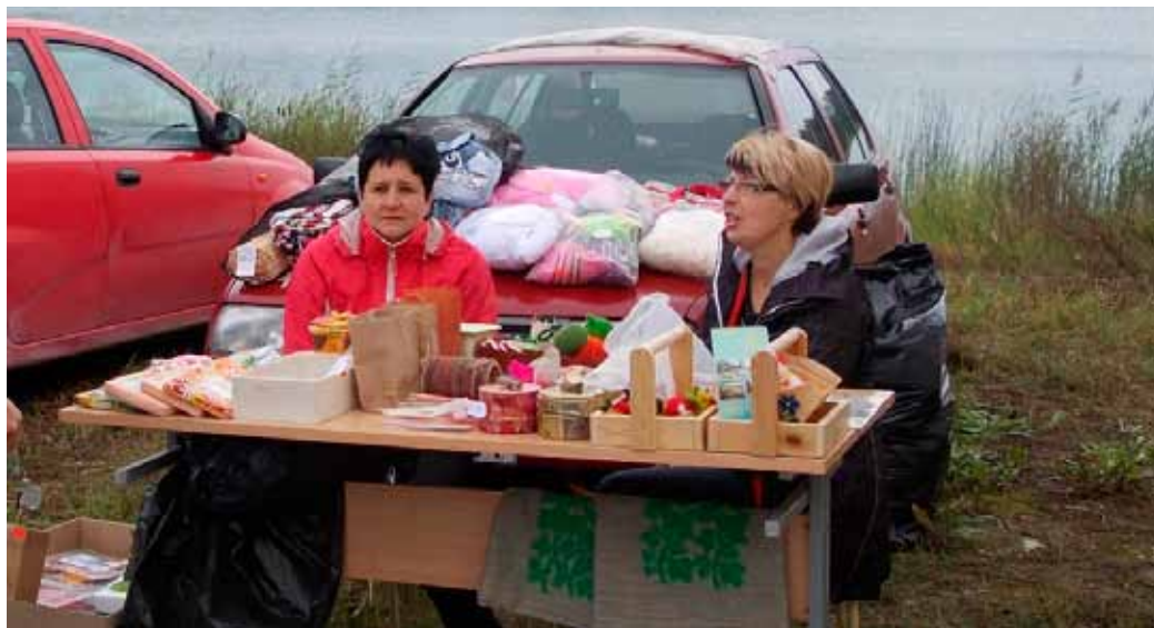
Koluvere hooldekodu klientide käsitööde müük Kullamaa Vibufestivalil.

Uudseks tööks on juba teist kuud helkurite pakkimine firmale SOFTREFLEKTOR. Selle