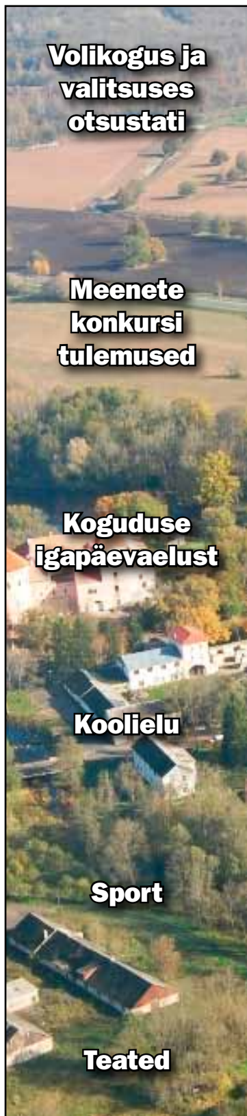
Vaade Koluverele 08.10.2011