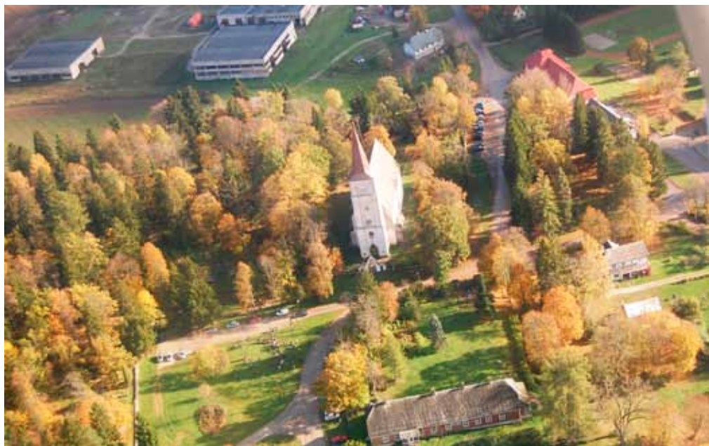
Vaade Kullamaale 08.10.2011