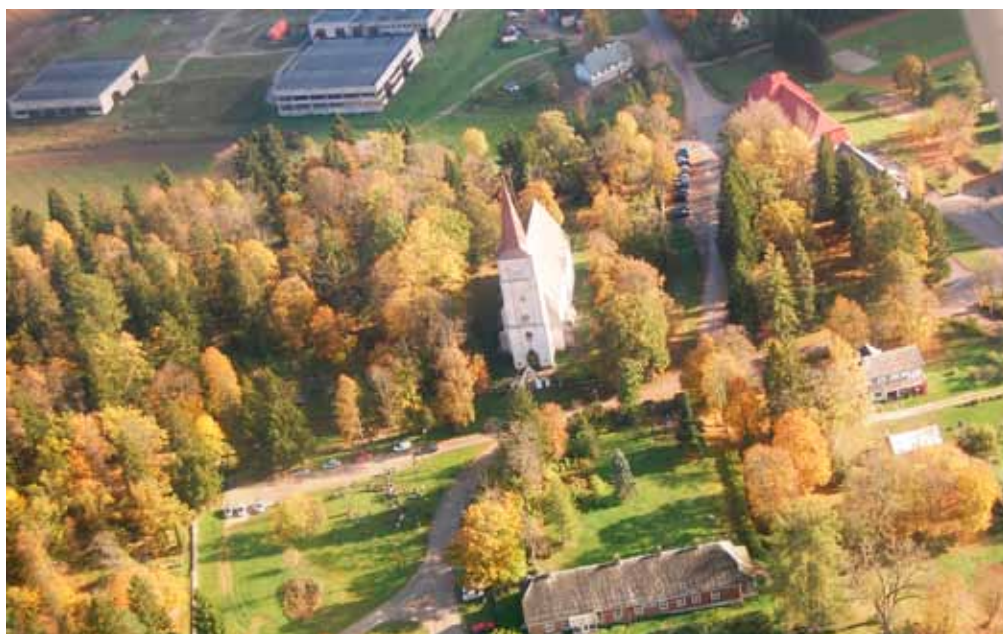
Vaade Kullamaale 08.10.2011