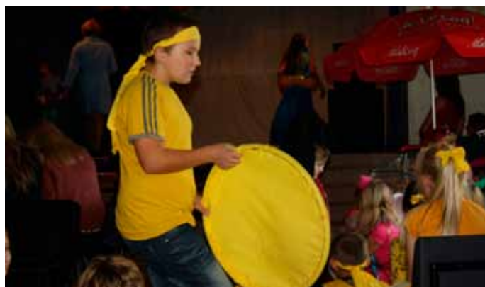
Suverõõmud. 5-6 klassi kollane päike.