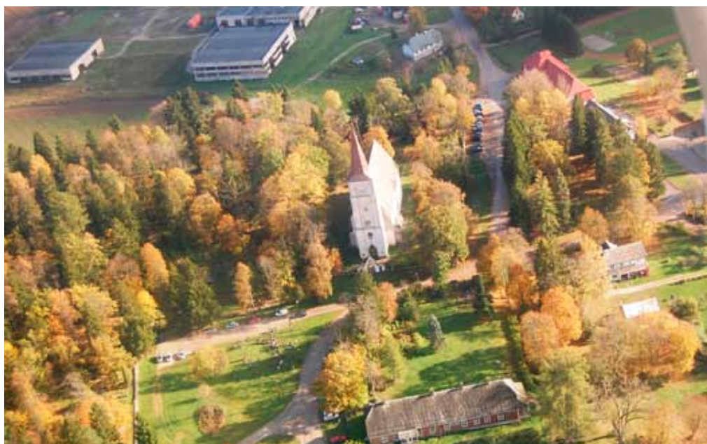
Vaade Kullamaale 08.10.2011