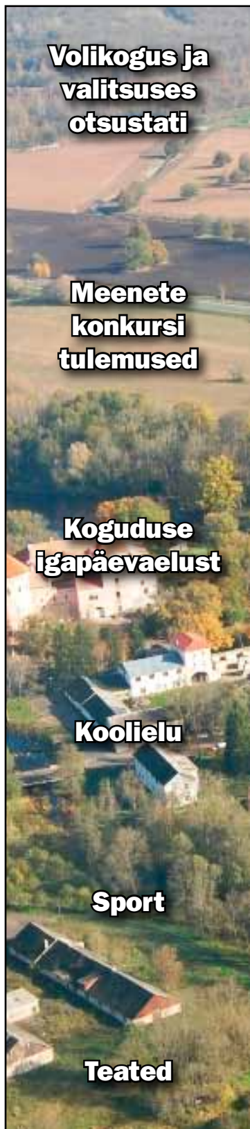
Vaade Koluverele 08.10.2011