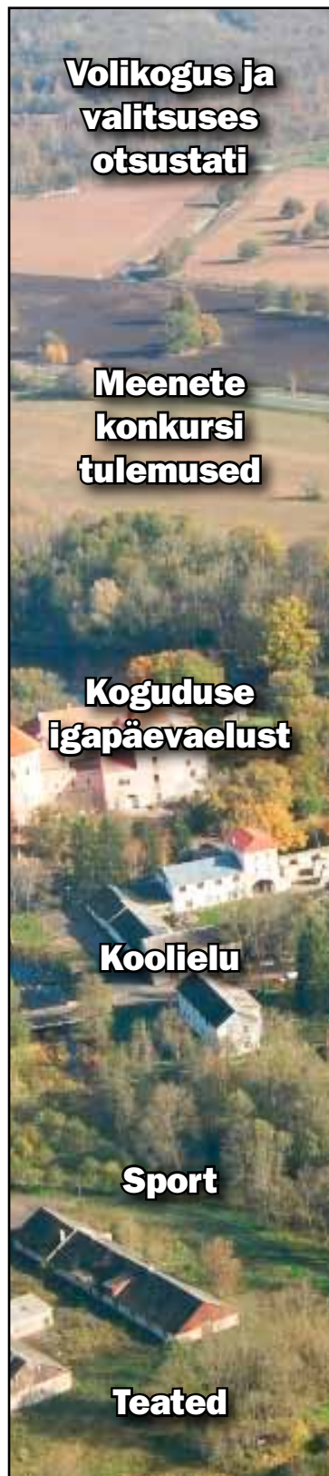
Vaade Koluverele 08.10.2011