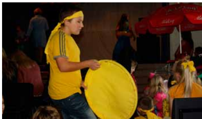
Suverõomud. 5-6 klassi kollane päike.